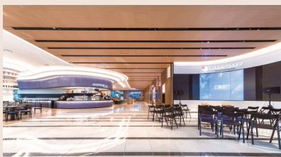
▲トゥモロウスクエア

55型ディスプレイ (W1,213.4×H684.2) 縦3台×横3台 計9台マルチスクリーン (W3,640.2×H2,052.6)