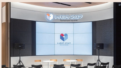
▲イベントスペースのデジタルサイネージ